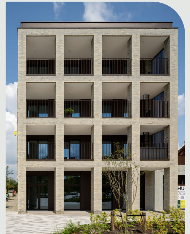
The Gallery, Antwerpen, 2023