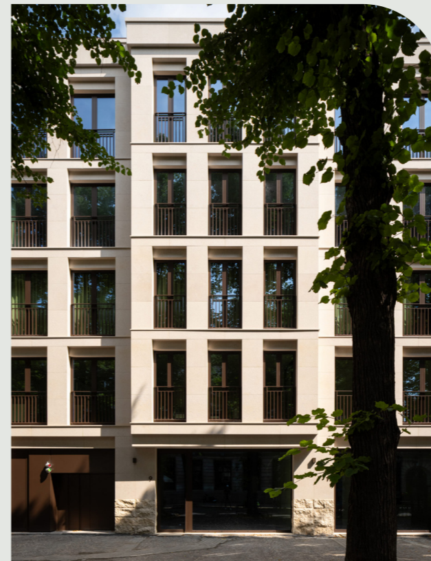
Graanmarkt, Antwerpen, 2023