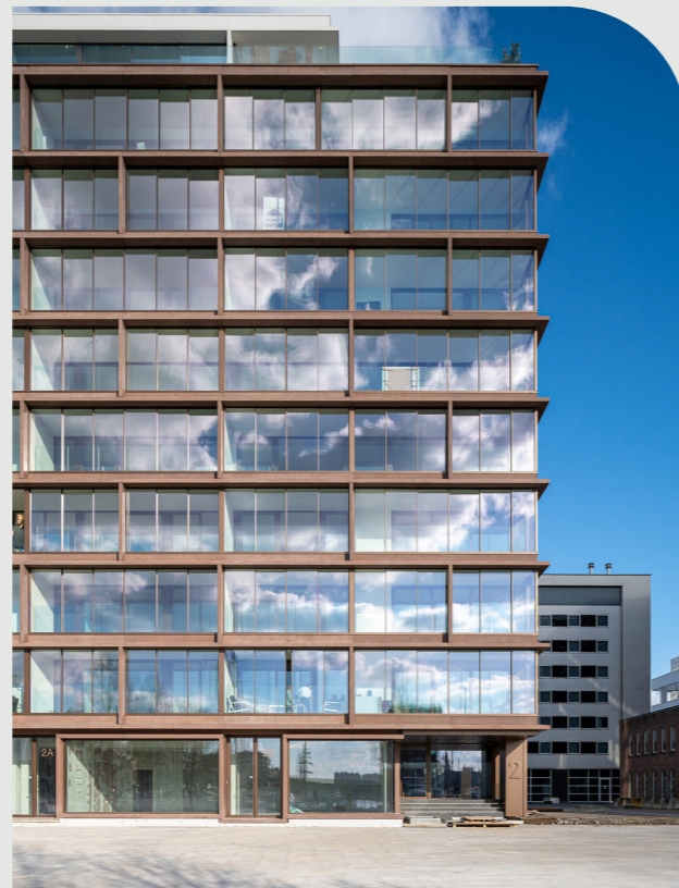
Aequor, Antwerpen, 2021

Naast Ankerrui heeft Bermaso een duidelijke expertise opgebouwd in residentiële stadsontwikkeling. In verschillende Belgische steden realiseerde en ontwikkelde Bermaso projecten die inspelen op de specifieke noden van bewoners én op de verwachtingen van investeerders.